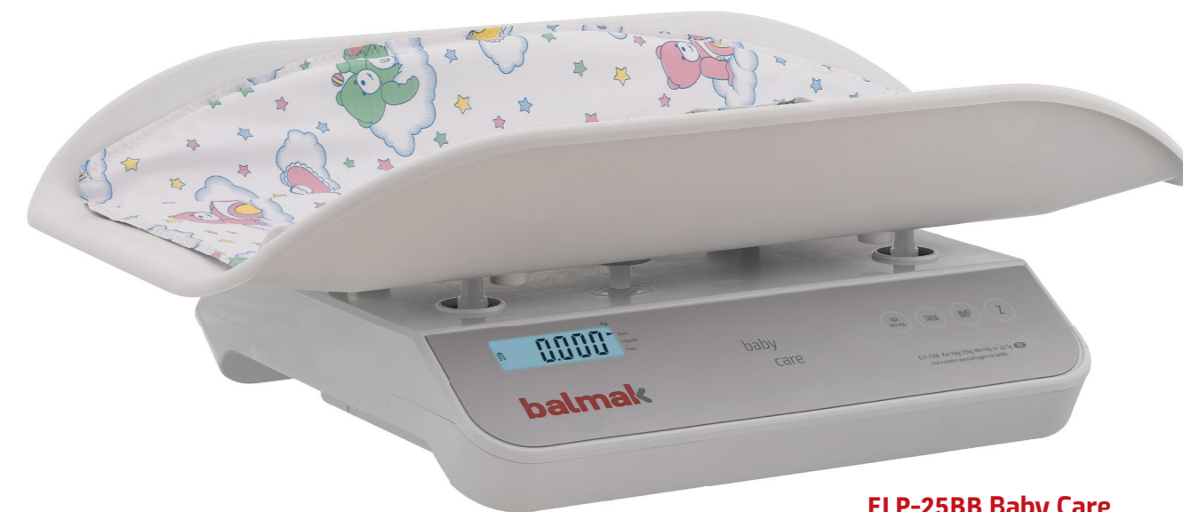
ELP-25BB Baby Care

Balança digital para pesar e medir bebês